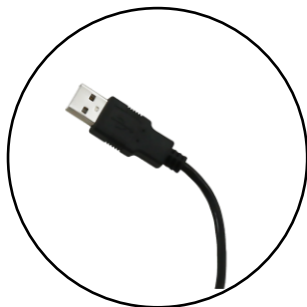
Plug & Play via USB

Die Oscilla AudioConsole ist die Software zur Bedienung der Oscilla Audiometer. Audiometrieren Sie automatisch oder manuell, sehen Sie alle Werte, zeigen Sie die Ergebnisse Ihrem Patienten, speichern Sie sie in der Datenbank,